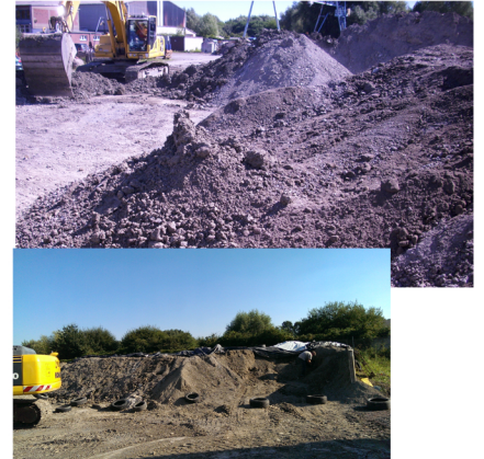
Vom heterogenen zum homogenen Ausgangsmaterial (unten rechts)

Mechanisch gut aufbereitetes Ausgangsmaterial ist die Grundvoraussetzung zur Herstellung von RSS Flüssigboden. Ist das Grundmaterial nicht homogen, so ist eine entsprechende mechanische Aufarbeitung des Bodens notwendig. Maßgebend für Anforderungen an die mechanische Aufarbeitung ist der auf der Rezeptur angegebene Toleranzbereich für das Ausbreitmaß sowie der Eigenfeuchte. Ist die Einhaltung dieser Toleranzen nicht möglich, so ist das Ausgangsmaterial weiter z.B. mittels Schaufelseparator aufzuarbeiten. ACHTUNG: die mechanische Aufarbeitung kann ein aufwendiger und damit kostenintensiver Faktor bei der Herstellung von RSS Flüssigboden sein. Sprechen Sie dazu ggf. im Vorfeld mit ihrem Fachplaner oder Mitarbeiter des FiFB. Ist das Ausgangsmaterial insgesamt nicht als rollig anzusprechen oder gibt es stark bindige Bereiche, so ist das Ausgangsmaterial mittels RSS PROVIACAL RD während des homogenisierens zu aktivieren.